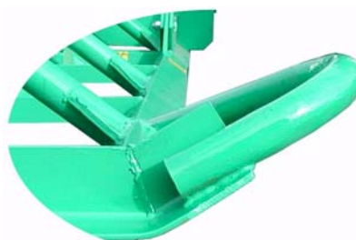
1. Schiene mit Bodenführungssohle, für schonende Vorarbeit

Die Kufen sind seitlich vorne hochgezogen, ein Einstecken wird somit verhindert