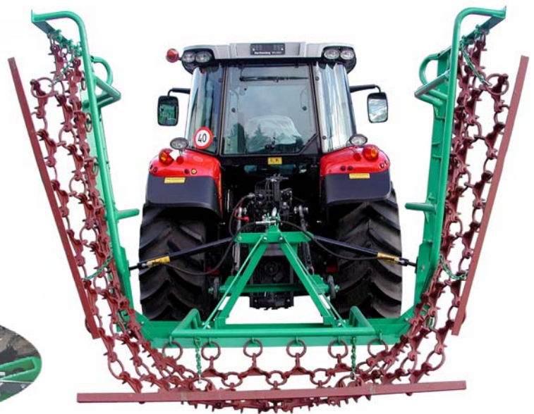
4, 5, 6 Meter hydraulisch zusammengeklappt

Anbausatz mechanische Verriegelung der Wiesenegge, bei hydraulischer Aushebung inbegriffen.