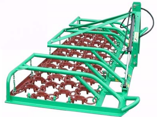
4 Meter mit leichtem Bock