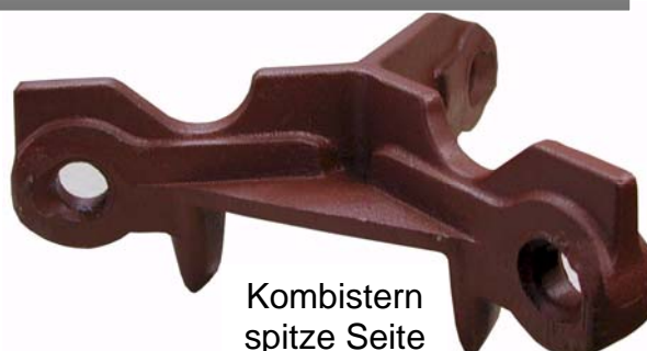
Kombistern spitze Seite

Die Wiesenegge KONDOR eignet sich hervorragend zum Abeggen von Wiesen und Weiden, sowie zum Ebnen und Planieren von Fahrspuren und Reitplätzen.