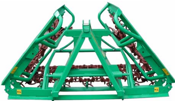
4, 5, 6 Meter mechanisch zusammengeklappt