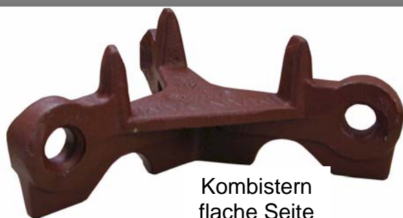
Kombistern flache Seite

Die Kondor Wieseneggensterne sind aus Sphäroguss gefertigt. Die Eggwerkzeuge sind durch diese Gussart sehr widerstandsfähig und dauerhaft.