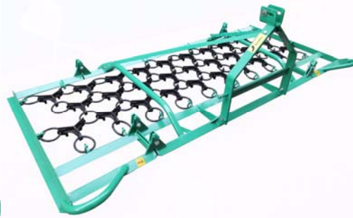
3,3 Meter Arbeitsbreite